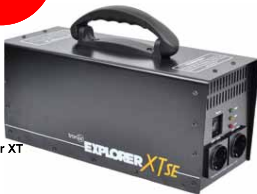
Explorer XT SE