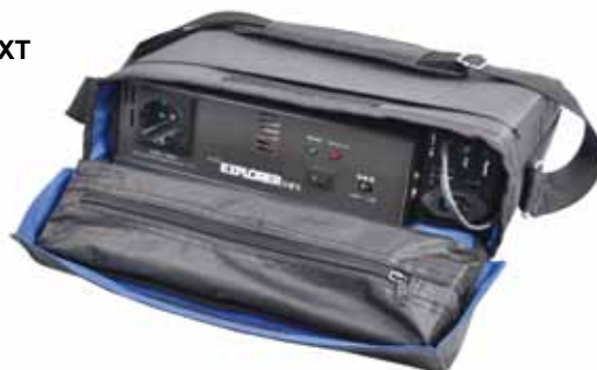
Explorer XT Mini