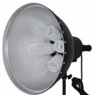
Foco luz fria con difusor 7 Lámparas y 3 potencias

TIJDD250220V LAMPARA HALOGENA 250 W 220 V. E27 13 € CL500W LAMPARA 500W./220 V E27 21 € TISP28 LAMPARA FLUORESCENTE ESPIRAL 28 W./220 v E27 5000° K bajo consumo 14 € TI MH150W LAMPARA METAL HALIDE 150W / 220 w 5400° k Para Imager MH800 38 €