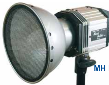
MH Imager 800