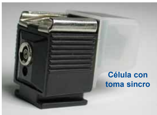
Célula con toma sincro