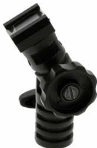
Rótula porta- paraguas con zapata