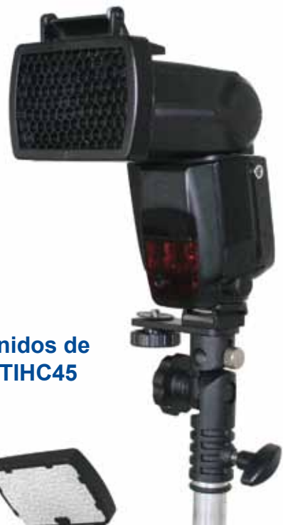
Set de nidos de abeja TIHC45