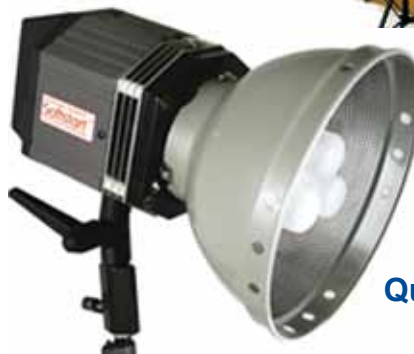
Quartz Imager 750