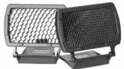
PANEL LED PARA FLASH PORTATIL Y CAMARA REFLEX TIHPL3