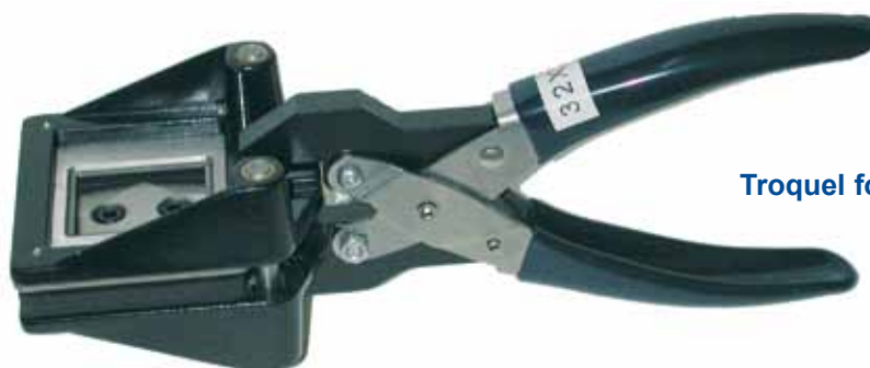
Troquel fotos de carné