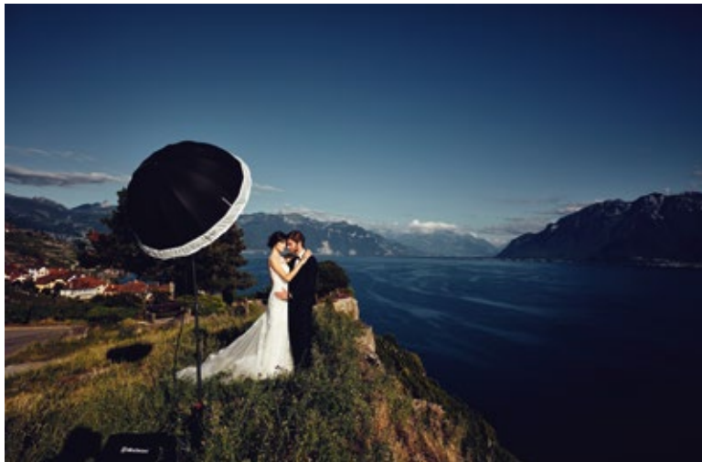
Esta toma fue creada utilizando un Elinchrom ELB 500 TTL con una antorcha, un parasol plateado Deep 105 y su difusor frontal.

Una vez que la cámara está lista, puede controlar el flash con el Elinchrom Transmitter Pro. Enciéndalo, y luego presione el botón TTL para dejar la mayor parte del trabajo técnico al sistema Skyport. Antes de disparar varias tomas, asegúrese de capturar una imagen de prueba y verificar que todo se vea bien. Si la potencia del flash no coincide con sus deseos, ajústela con el dial.